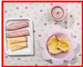
jambon pain beurré