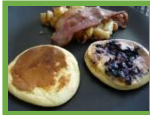
muffins œufs bacon