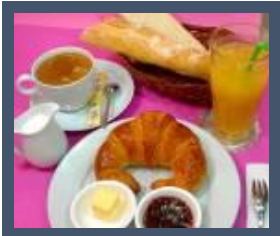
pain beurre confiture

http://www.lemonde.fr/m-perso/portfolio/2014/11/27/le-tour-du-monde-des-p-tits-dej_4527452_4497916.html