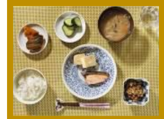
haricot soja fermenté